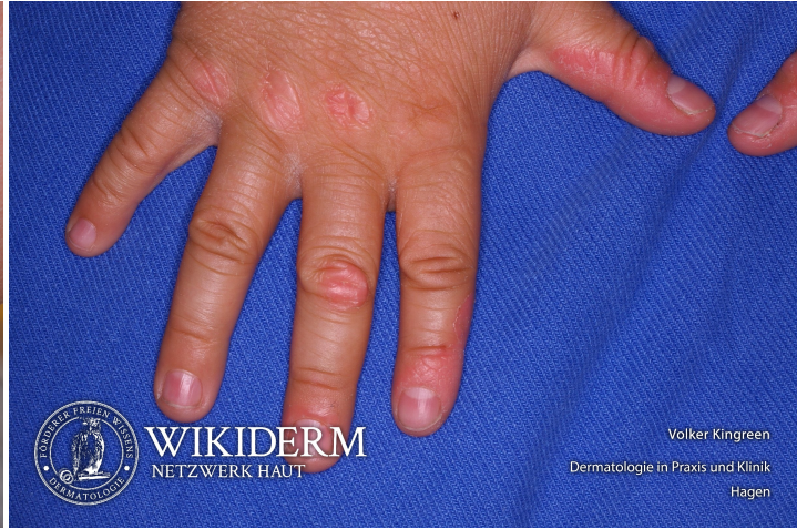
👤 lamelläre Ichthyose, Abb. 2