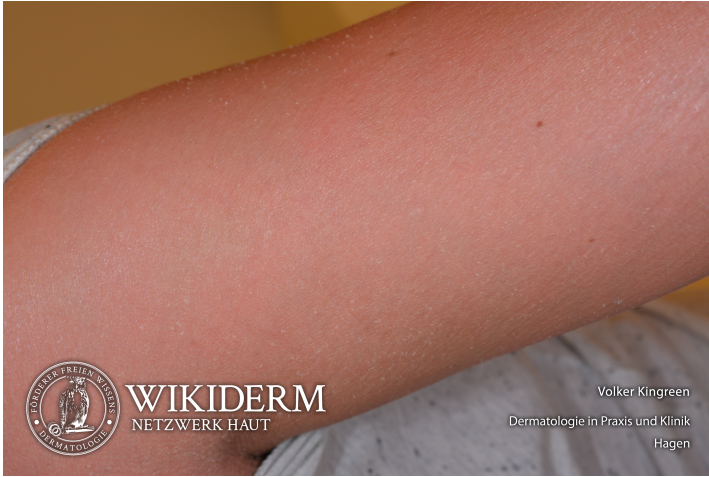
👤 lamelläre Ichthyose, Abb. 1